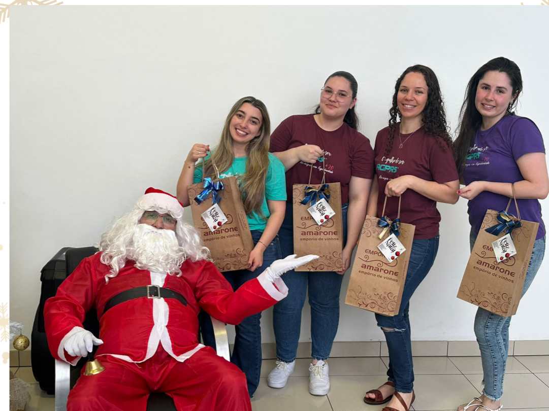
RH - GESTÃO DE PESSOAS