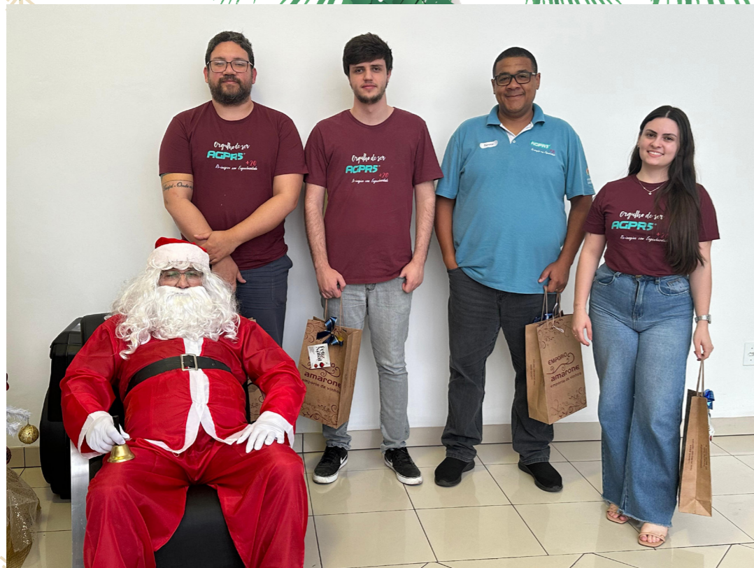
SERVICE E SUPORTE