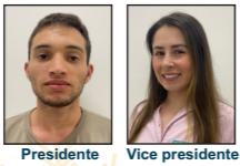
Presidente Vice presidente