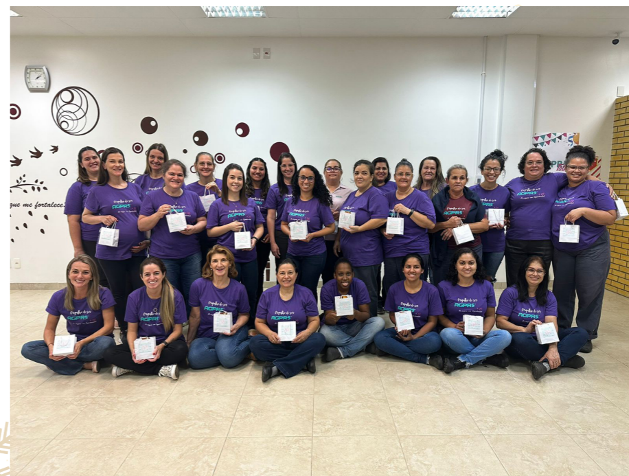
DIA DAS MÃES