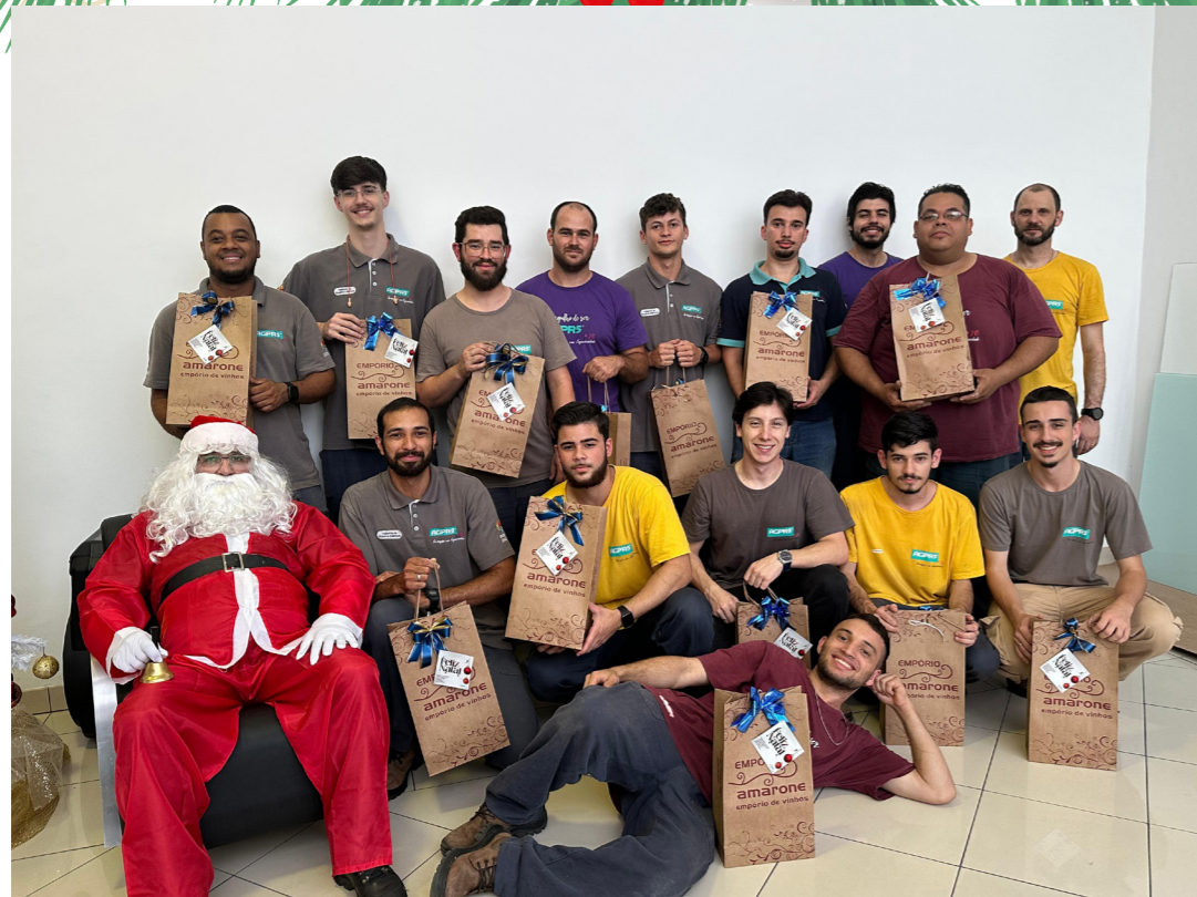
INDÚSTRIA DE QUADROS ELÉTRICOS