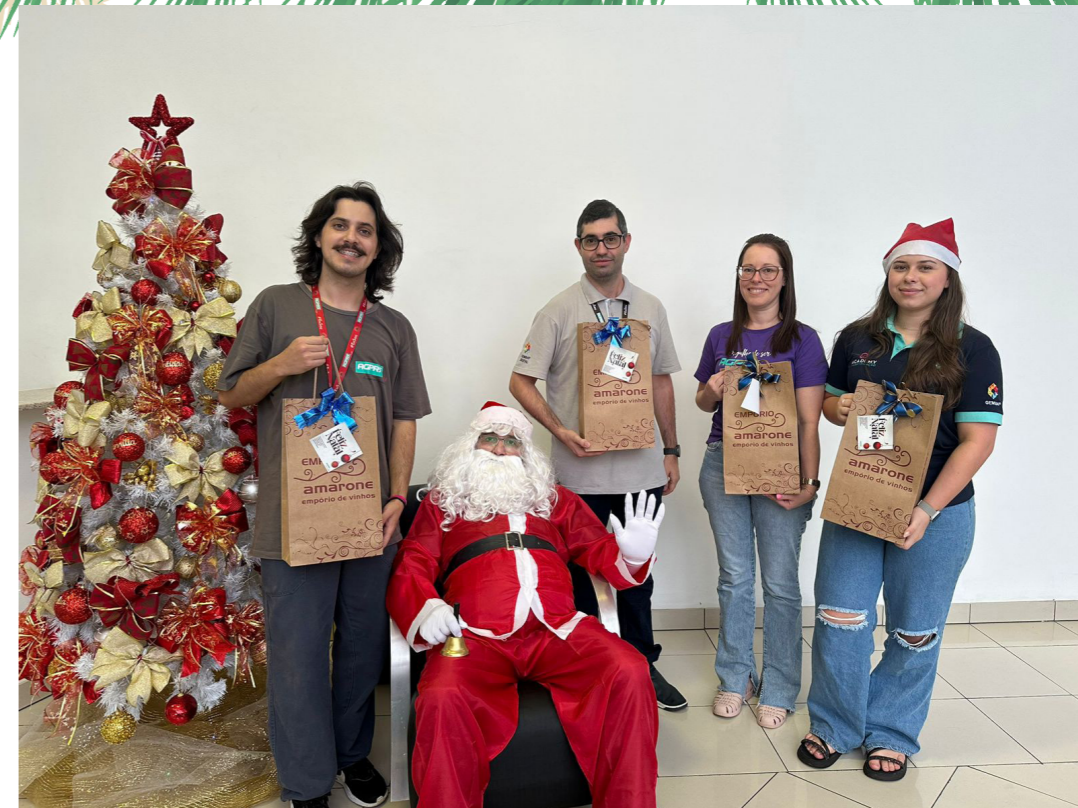
MARKETING E T.I.