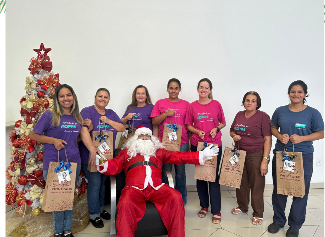
COZINHA E SERVIÇOS GERAIS