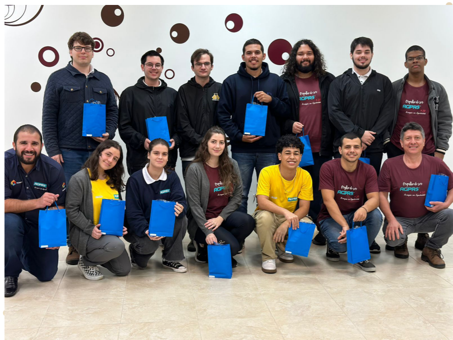
DIA DO TRABALHADOR