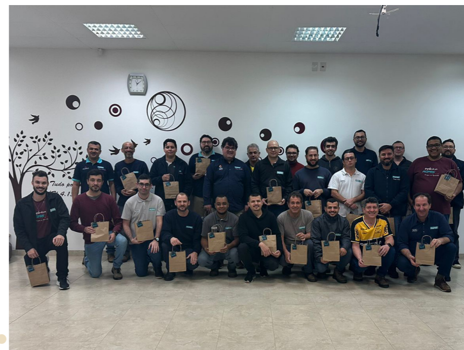
DIA DOS PAIS