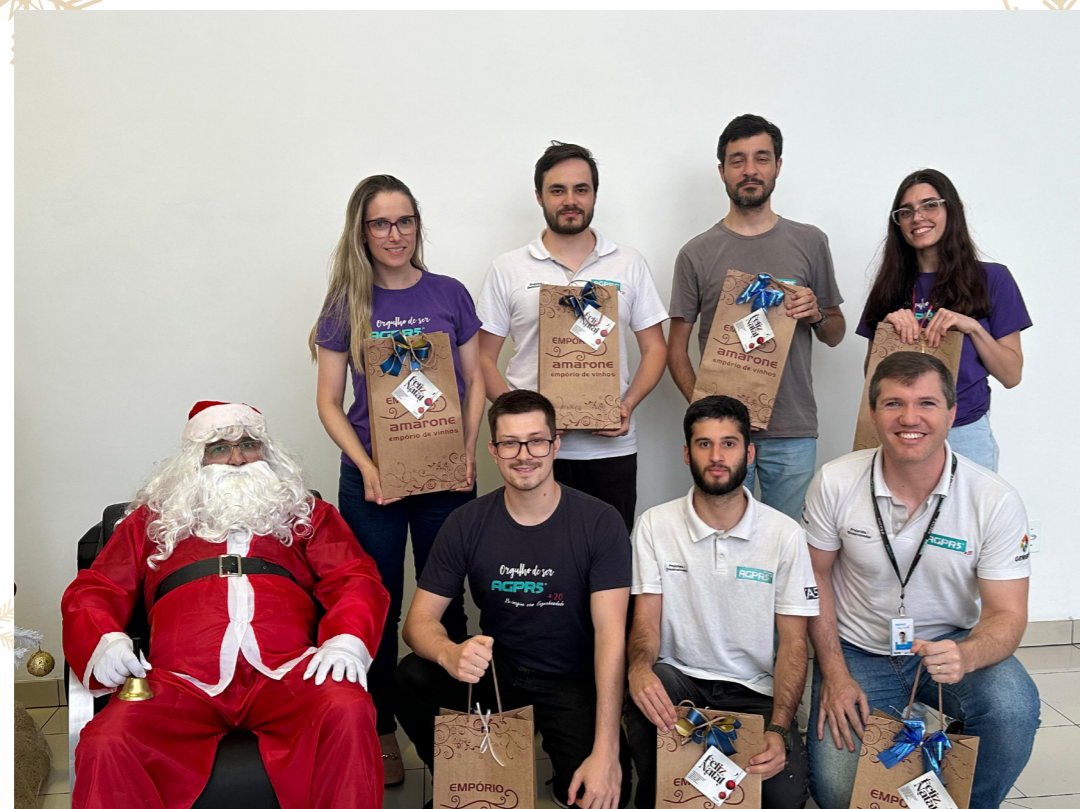
PROJETOS DE INSTALAÇÕES ELÉTRICAS PROJETOS DE QUADROS ELÉTRICOS