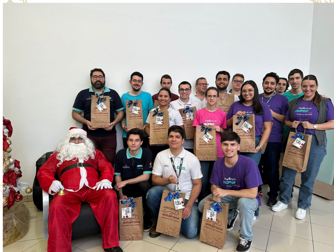
SOFTWARE E AUTOMAÇÃO