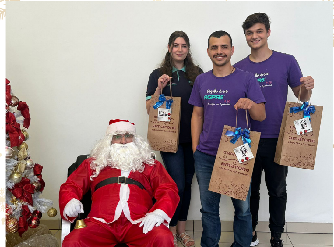
GEMBA DIGITAL SYSTEMS PLATFORM